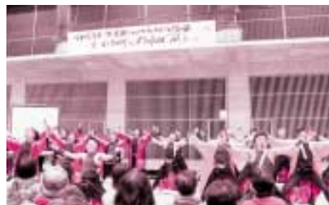
オープニングアトラクション「笑」

今年度の西尾張BVFは昨年度の「つどい」をベースとして、市内外のボランティア団体や福祉施設等51団体の出展・出店を柱に、老若男女誰もが楽しめる企画として障がい者・ニュースポーツ体験、災害に関する講演会、懐かしい遊び体験、加えて鳴子踊りや和太鼓演奏など賑やかなステージアトラクションもおこない、約800人の来場を得て、終始賑やかに盛況のうちに幕を閉じることができました。