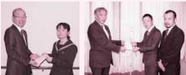
犬山高校生徒会 様