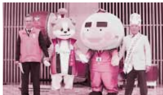
次年度開催稲沢市への引継式を終えて