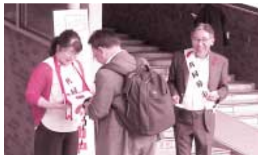
赤い羽根街頭啓発募金活動（犬山駅）

朝の慌ただしい時間にもかかわらず、市民の皆さまがしばし耳を傾け、足を止めて募金にご協力いただきました。