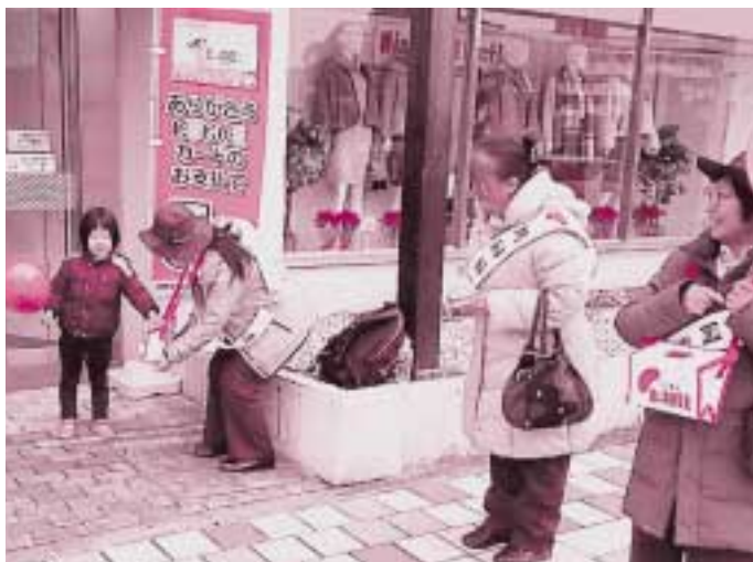
歳末たすけあい街頭募金（ヨシツヤ犬山店）

共同募金は、皆さまの善意によって成り立っています。募金活動をボランティアでくださった皆さま、募金にご協力くださった皆さまに改めて深く感謝申し上げます。