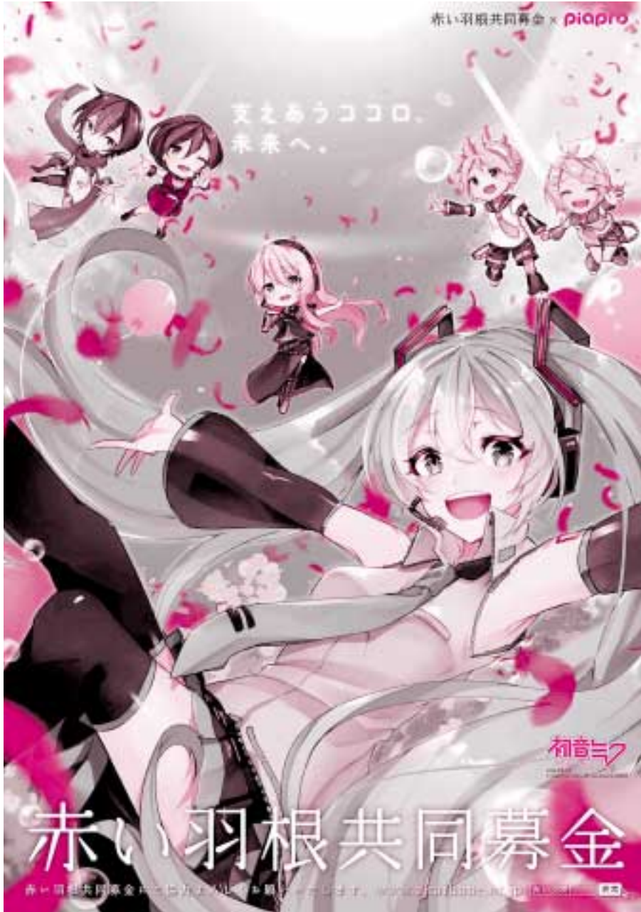
令和2年度 赤い羽根共同募金ポスター (初音ミク版)

Art by 0214 ©Crypton Future Media, INC. www.piapro.net piapro