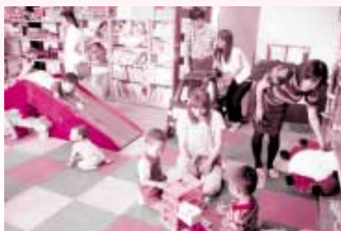
おもちゃ図書館の様子