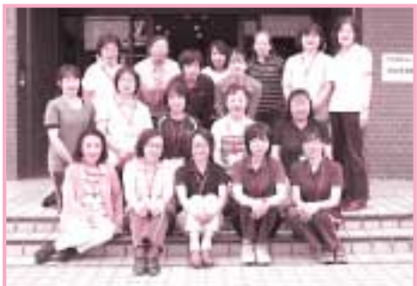
ヘルパー集合写真

援助を必要としている市内の高齢者や障がい者(児)の皆さまの暮らしを支える仲間を募集しています。