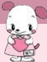
犬山市社会福祉協議会 マスコットキャラクター 「福ちゃん」