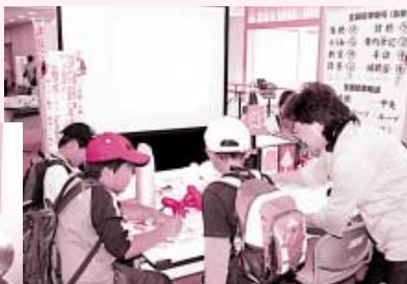
福祉まつり（市民健康館）