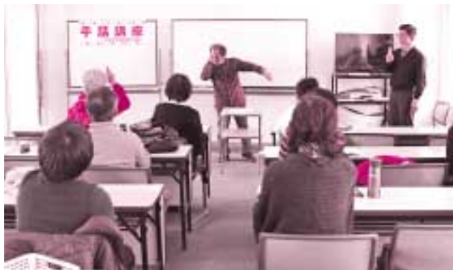
昨年の講座の様子。あいさつや名前の表し方を楽しく学びました。