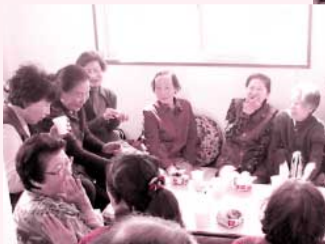
ふれあい・いきいきサロン（楽田東子ども未来園）

なお、町内会に加入されていない世帯については、福祉会館2階社会福祉協議会の窓口で受け付けていますので、会員加入をお待ちしています。