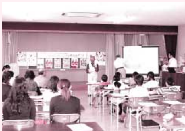
昨年度の助成審査会のようす（塔野地公民館）